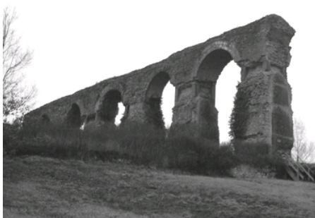
Aqueduc de Jouy aux Arches (sud de Metz)