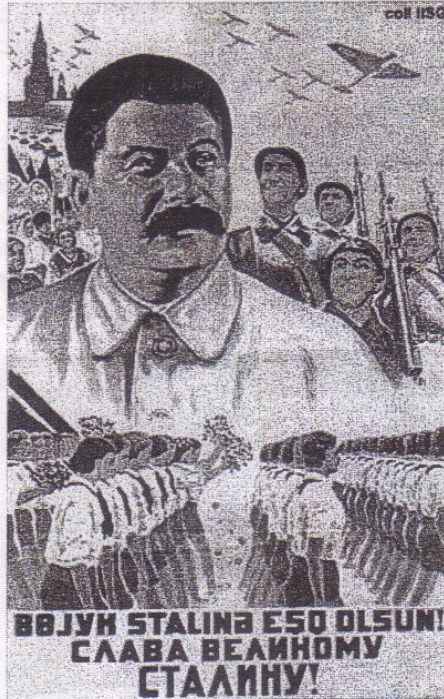
Affiche de 1938 « Longue vie au Grand Staline ! »

1. Comment Staline est-il mis en valeur sur cette affiche ?